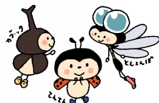
港北図書館キャラクター