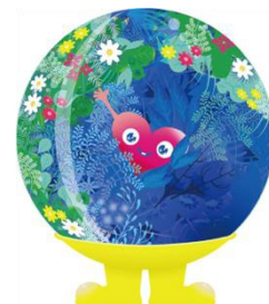
公式マスコットキャラクター 「トゥンクトゥンク」