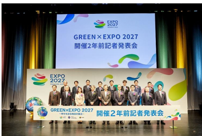
Village 出展・テーマ営業出店内定者

※Village 出展、花・緑出展、テーマ営業出店の各内定者より個別リリースが発出されている場合がございます。