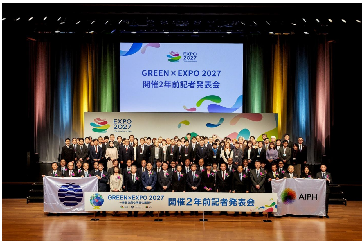
2年前発表会に参加された出展内定者一同