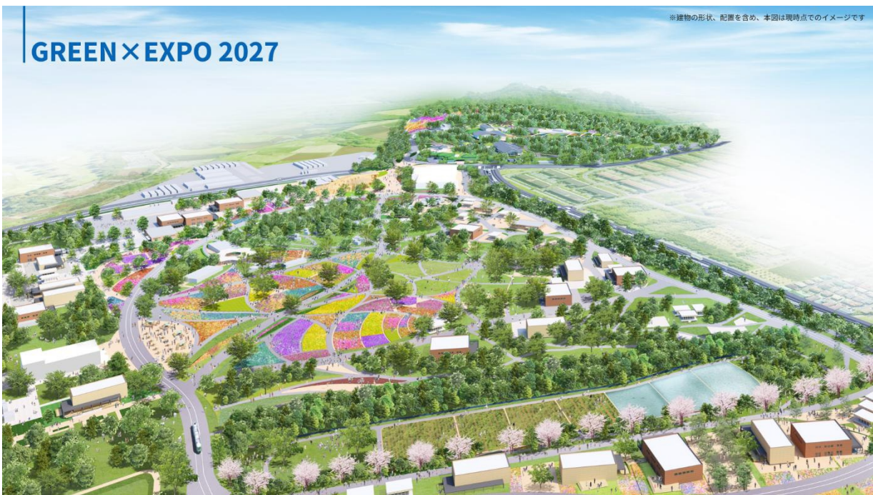
空から見た GREEN×EXPO 2027 会場