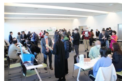
▲事業者ブースで説明を受ける自治会町内会の様子