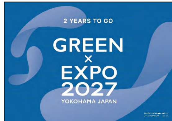
〈開催2年前限定デザイン〉