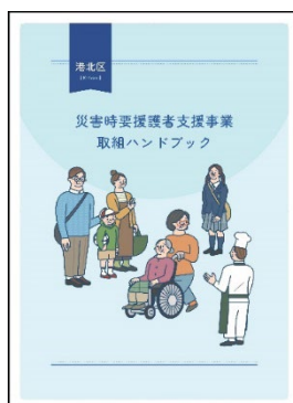
改訂版ハンドブック表紙