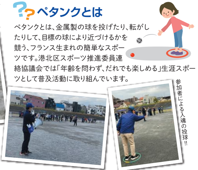
大会委員長による円滑なマイク進行