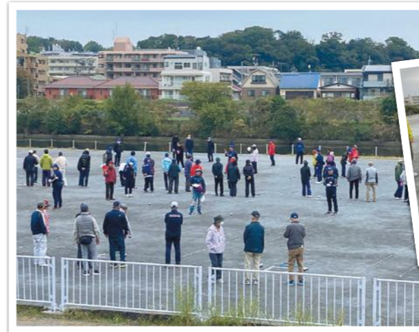
スポ進は審判等の運営で従事しました。