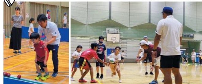
子どもたちを見守り、指導をする委員たち(左:ポッチャ/右:タグラグビー)

開催日 7月21日(日) 会場 横浜市港北スポーツセンター スポ進動員数 37人