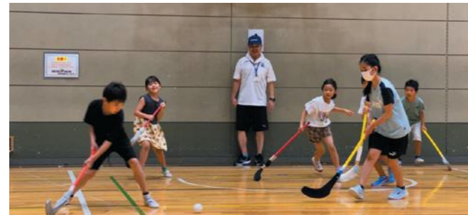
夢中になり、活発に動く子どもたち。(ユニホック)

7月21日(日)、港北スポーツセンターで開催。参加者はのべ384人と昨年の1.4倍近くに増えた。小学4年生以下が約9割で、ユニホック、ポッチャ、タグラグビーなどは、初体験だった者も多かったようだが、夢中になっている姿が見られた。保護者からは「子どもの年齢や体調に合わせて自由に好きなスポーツを選べるのが良い」、「短時間ながら色々な種目が楽しめた」、「子ども達