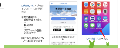
↑事例発表の一部抜粋