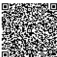
←感想等受付の 二次元コード

https://shinsei.city.yokohama.lg.jp/cu/141003/ea/residents/procedures/apply/8ef0a07d-9b2e-4de4-ae3a-aa6fc753abff/start