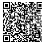
事例発表の 二次元コード