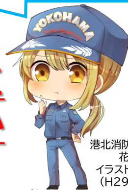
港北消防署キャラクター 花水木ゆい イラスト制作:K条ミキ (H29YDA卒業生)

最近、どこにいても 救急車のサイレン音を 聞かない日はないよね？ そこで…クイズ！！