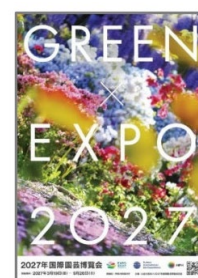
掲示用 広報チラシ

※4月に依頼しましたチラシが掲示板に残っており、劣化がある場合には、新しいチラシに貼り替えていただきますようお願いいたします。