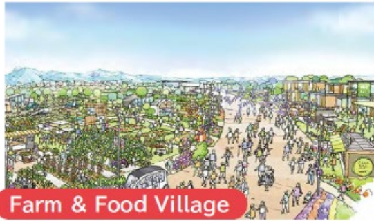
Farm & Food Village

自然と共に生きる知恵と技が込められた、日本の伝統産業などの温故知新を体感できます。