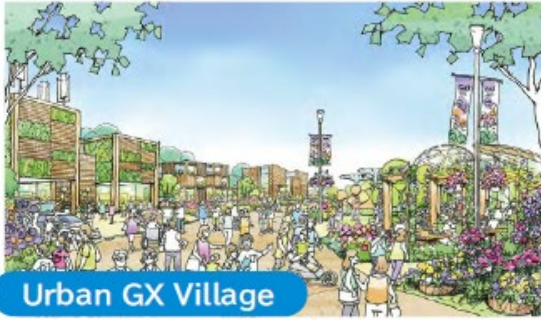
Urban GX Village