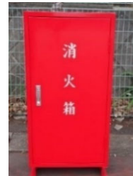
初期消火箱（固定式）

初期消火器具には、初期消火箱（固定式）とスタンドパイプ式初期消火器具（可搬式）の2種類があり、消防車が進入できない道路狭隘地域等においても、市民の皆さまが消火栓にホースを直接接続し、有効な初期消火活動を行うことができる消火器具です。特にスタンドパイプ式初期消火器具は機動性に優れ、容易に取り扱うことができます。