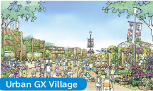
Urban GX Village