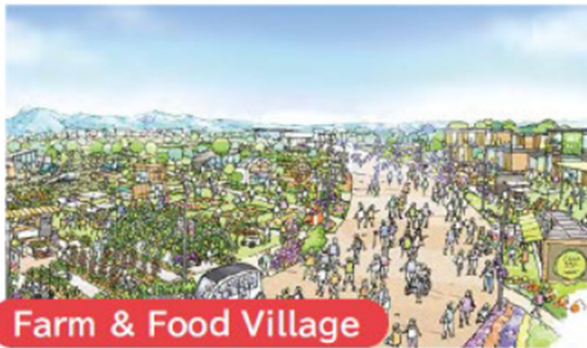
Farm & Food Village

自然と共に生きる知恵と技が込められた、日本の伝統産業などの温故知新を体感できます。