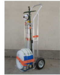
スタンドパイプ式 初期消火器具(可搬式)