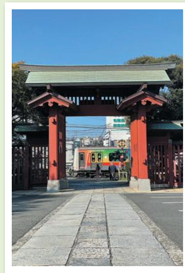
ふるさと港北ふれあいまつり賞 「名刹の朝」