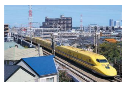
優秀賞 「みんなの人気者」