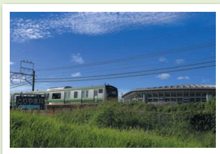
JR東日本賞 「YOKOHAMA LINE STADIUM」