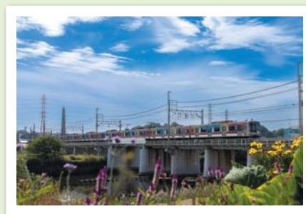
相鉄・東急賞 「華やかな共演」

令和5年11月に開催された「秋のヨコアリくんまつり」来場者の投票により、最優秀賞・優秀賞を決定しました!