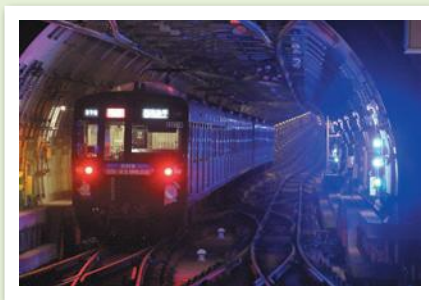
優秀賞 「新路線開業」