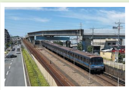
市営地下鉄賞 「ブルーラインと青い空」