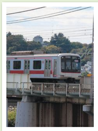
ヨコアリくんまつり賞 「大倉山記念館と東横線」