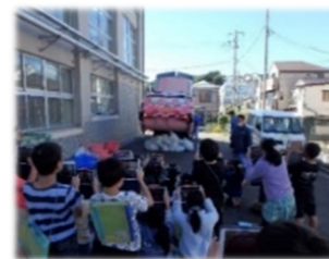
小学校向けの出前講座