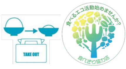
小盛りやテイクアウトの飲食店を認定する「食べきり協力店」の利用促進