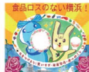
ポスターコンクール