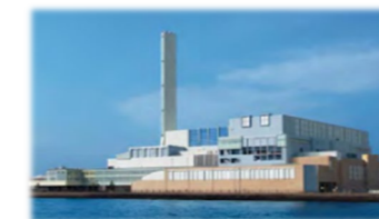
工場の新設・長寿命化工事