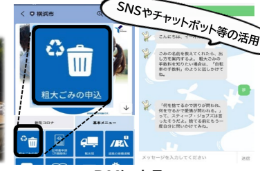
DXによる行政サービスの向上と効率化