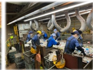
リサイクルのために缶・びん・ペットボトルを選別