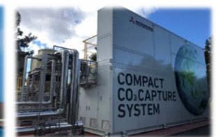
焼却工場のCO 2 回収 (CCUの実証試験)