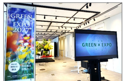
出展事例 (2) ローズフェア with 趣味の園芸