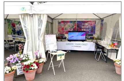
出展事例 (1) 春の里山ガーデンフェスタ