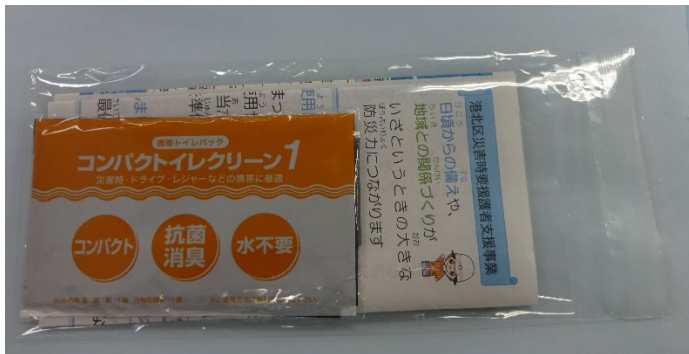
<トイレパックとチラシのセット>

携帯トイレパックと啓発チラシ2種類をセットにして、名簿と同封して各自治会町内会長宛に、新規掲載者数に応じた個数を提供します。（新規掲載者が10人未満の場合は10個提供） ※協定を締結していない自治会町内会にも、10個提供します。