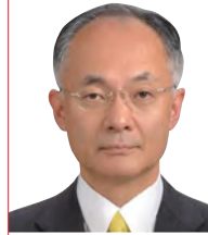
辻 琢也 氏 一橋大学大学院法学研究科教授

同志社大学文学部卒業後、CBCテレビにアナウンサーとして入社。バラエティ番組から報道番組まで幅広く担当する。「ゴソマ〜GOGO!Smile!〜」(CBCテレビ制作、月〜金13:55〜)の番組開始時からMCを務める。2020年3月にCBCを退社しフリーアナウンサーへ転身。2019年の週刊文春の好きなアナウンサーランキングでは、在京キー局の有名アナに混じって異例の5位、2021年のJ-CASTニュースの好きなワイドショーのMCでは1位を獲得。著書「ゴソマ石井のなぜか得する話し方」(ダイヤモンド社)などがある。