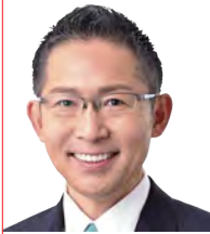
中川 貴元 氏 総務大臣政務官

早稲田大学商学部卒業、名古屋市議員(平成7年4月当選後、7期連続当選)、名古屋市議員、指定都市議事会会長、衆議院議員初当選(第49回総選挙)、自由民主党法務・自治関係団体委員会副委員長、自由民主党財政・金融・証券関係団体委員会副委員長、自由民主党地方組織・議員総局次長を経て、令和4年8月総務大臣政務官(第2次岸田改造内閣)