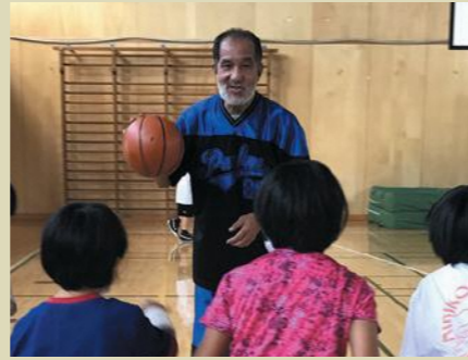
沢山で、地域の方々や色々な方々(プロ)と知り合えるのも楽しいですよ。興味が有る方は自分の住んでいる各町会長にご相談下さい。若い良き仲間たちを御待ち致しております。

あれから30年、昨日のように思い出します。我が子の為に駒小でミニバスを発足し、監督をしたばかりのため、スポーツ大好き人間としてはスポーツを指導する委員と聞き、引き受けました。今まで仲間達に大変お世話になり、良き仲間達に恵まれて、非常に楽しく地域、町会、区、市など様々なイベントに携わりました。沢山の方々と知り合いに成り、私と致しましては非常に良き人生経験をさせて戴いております。これからもよろしくお願ひいたします。スポーツ推進委員は非常に楽しい事が盛り