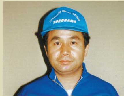
がらスポーツ推進委員の一員として、精一杯勤めていく所存ですので、今後ともよろしくお願ひいたします。

進委員の職務を振り返ると、寒風吹きすさぶ中での「横浜国際女子マラソン大会」の沿道警備、観客がほとんどいないのに警備をする必要があるのかと感じた事や、港北スポーツ推進委員のイベントの一つである「ペタンク大会」の港北に特化したルールやスコアカード等の作成、また、樽町公園での港北マラソンでの炊き出し等が、今となっては懐かし思い出されます。 定年まで残り僅かとなりましたが、微力な