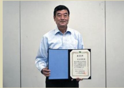
で、今後も定年まで楽しく活動を続けたいと思います。

25年前、体育指導員になった初めの頃は内容を把握するもことなく、言われるままにお手伝いをしていた程度でした。年数を経て経験を積むことで各種イベントの内容については分かるようになってきていましたが、まだまだお手伝い程度の意識で活動していました。 大きく変わったのが地区の会長になり、スポ進の活動の目的・本質を考えるようになったことです。ただ変わらないのが、自分自身も楽しむということ。それが長く続けられた理由