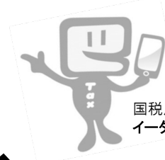
国税庁e-Taxキャラクター イータ君