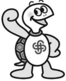
神奈川県マスコットキャラクター かめ太郎