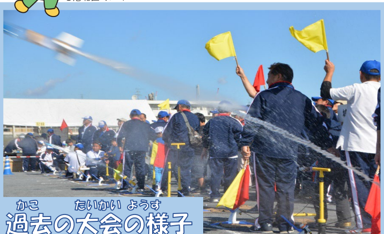
かこ たいかい ようす 過去の大会の様子

ひきよりぶもん 飛距離部門 (30人) ※多い場合は抽選 ペットボトルロケットを と飛ばして きより きぞ 距離を競おう!!