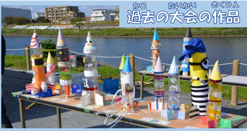
かこ たいかい さくひん 過去の大会の作品