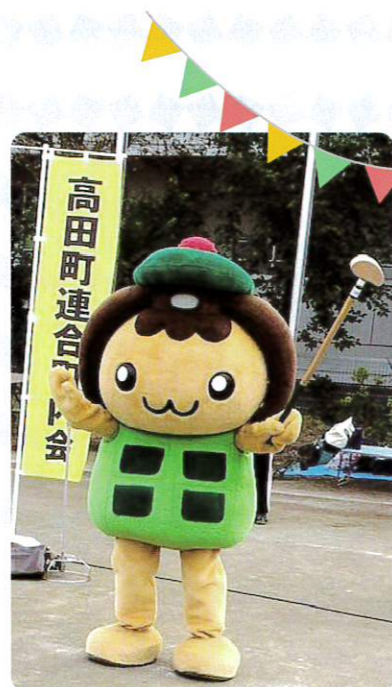
高田地区のユルキャラ たかたん

地域活動には、ペタンク大会、 グラウンドゴルフ大会、ソフトバ レーボール大会、駅伝大会、高田 地区大運動会(残念ながら、近年 はコロナ禍の為開催できませんで した。)などがあります。令和3年 の活動では、コロナ禍を縫って、 ペタンクの実地試験を行い、動画 を作成してみました。これらの地 域活動を通じて、顔の見える関係 づくりに取り組み、誰もが健康で 支え合いのあるまちづくりを目指 しています。