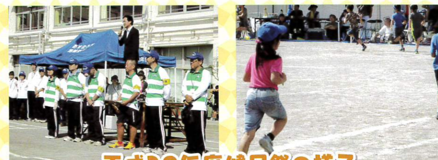
平成29年度健民祭の様子