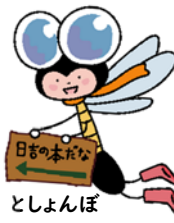
港北図書館 キャラクター