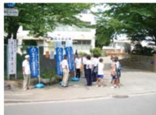
ひと声かけ運動の活動の様子

こころの持ちようで誰にでも参加していただけるボランティア活動です。となり近所の幼い子どもへの「おはよう、こんにちは…」からはじまる日常会話が、子どもとの関わり大切な一歩だと思います。私たちの街を私たちの手で犯罪のない安心して子育てのできる街にしたいものです。