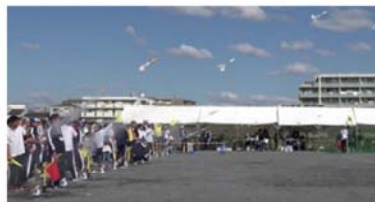
ペットボトルロケット発射!