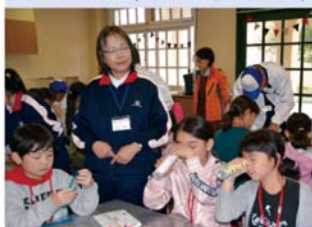
ソレイユの丘(第5回,第10回)