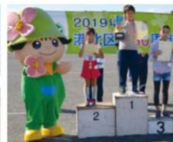
ミズキーから表彰