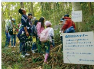
愛川ふれあいの村(第2回)