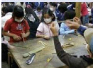
足柄ふれあいの村(第1回,第6回)

幼い頃から本物に触れさせ、いのちを感じるセンスを実体験をとおして体得させることを目的として、平成21年度から「自然体験教室」を行っています。様々な体験により、「虫の声や空気のきれいさを感じた」、「森の大切さがわかった」など子どもたちにとっても貴重な体験となったのではないかと感じています。