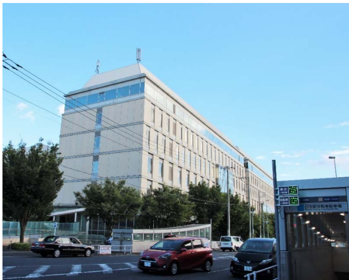
【建物外観（日吉駅前）】

慶應義塾大学日吉キャンパス内「協生館」 1階（約60㎡） 神奈川県横浜市港北区日吉四丁目1番1号