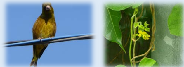
写真：事業区域及びその周辺で確認された動植物例 （左）カワラヒワ （右）タンキリマメ

その結果、環境の保全のための措置に取り組むことで、環境保全目標は達成されると評価されました。