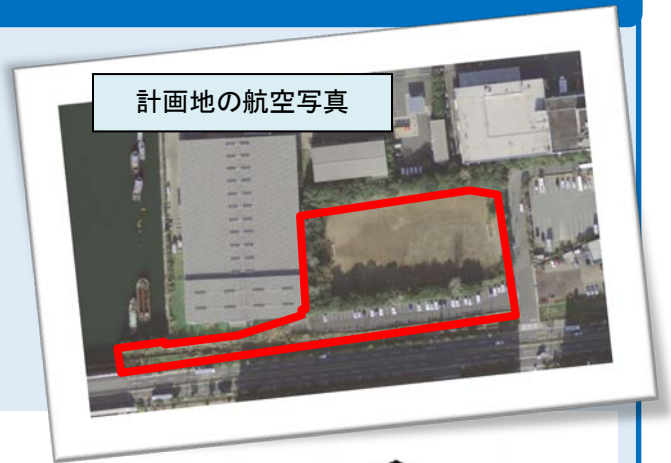
計画地の航空写真