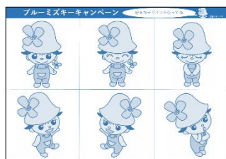
キャラクター画像