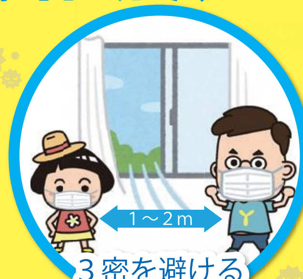
3密を避ける ※家庭内でも

外出時や屋内でも会話するときは、可能な限り 真正面を避け、人との間隔がとれない場合は、 症状がなくてもマスクをつけましょう。