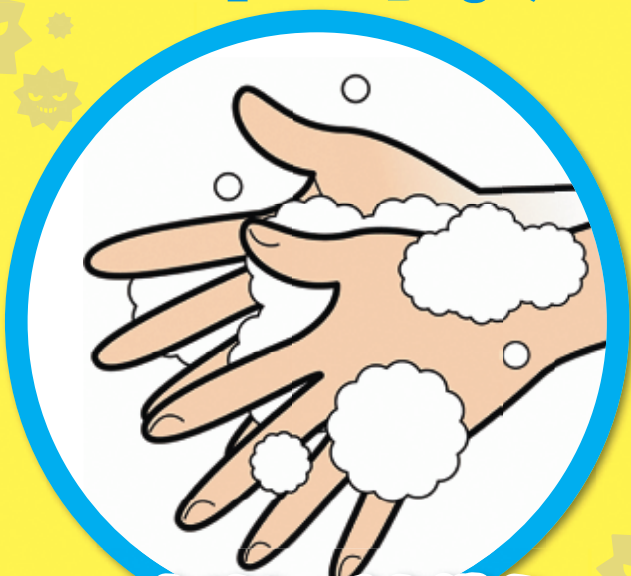
こまめに手を洗う

帰宅時や調理の前後、食事前などに せっけんを使って洗いましょう。 アルコール消毒も有効です。