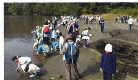
干潟で生き物を探す子どもたち(地図⑤)