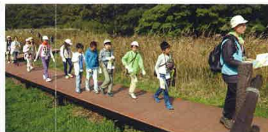
「ガマの穂」の湿地帯(地図④)