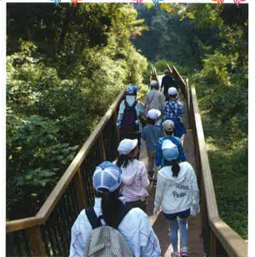
木道を下りて森へ入ります(地図②)