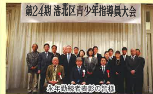
永年勤続者表彰の皆様