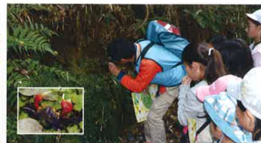
アカテガニのマンション(地図③)