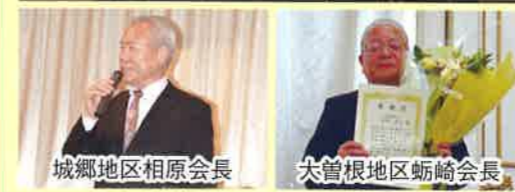
城郷地区相原会長