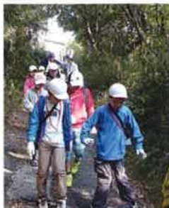
バス下車場所から森へ