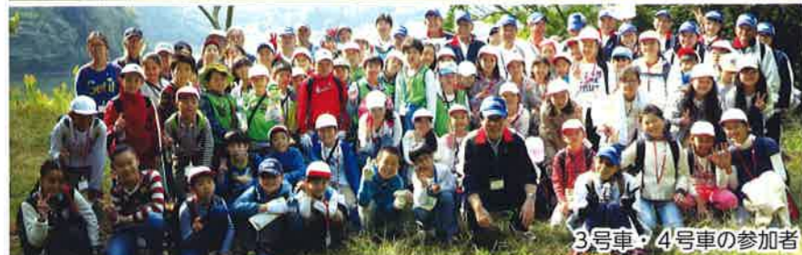
3号車・4号車の参加者