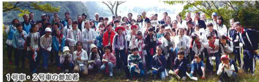
1号車・2号車の参加者

当日は、区役所前広場で開会式を行い、大型バス4台で出発しました。往きの車内では、「小網代の森」の散策について同行していただいたNPO法人小網代野外活動調整会議の説明委員(以下、説明員)から詳しい注意事項がありました。