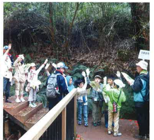
クイズをしながらの散策(地図③)