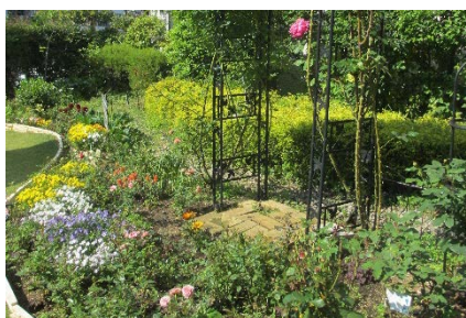
▲グリーンコーポ篠原 いこいの広場

まちを彩る、私たちの身のまわりの公園や大小さまざまな街かどの花壇。日頃、ボランティアの皆さん等が心を込めてお世話されています。ぜひ足を止めて、季節のお花を楽しみながら、普段気づかないまちの魅力を見つけてください！