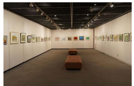
旭区「サンハート」ギャラリー

そのほかにも、「照明設備は光の強さを調節できると良い」、「展示主催者が長期間滞在するため、主催者の休憩や来客との歓談のためのスペースが必要」といった意見がありました。