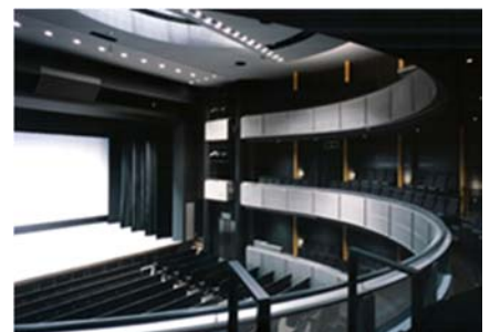
演劇系ホール：出演者の表情や身振りなどが鑑賞でき、一体感が味わえるよう舞台と客席との距離が工夫されているほか、セリフを聞き取れるよう残響時間を短くしています。