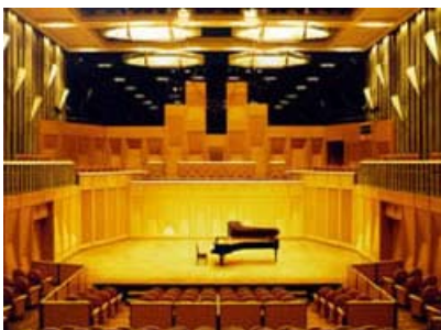
音楽系ホール：残響時間が長くなるように設計されておりクラシック演奏に適しています。

他区の区民文化センターでは、音楽系ホールや演劇系ホールなど特定の用途に特化したホールが整備されたこともありますが、近年では技術の進歩に伴い多目的ホールでも十分な音響性能が確保できるようになったことなどから、多目的ホールが整備されるケースが多くなっています。