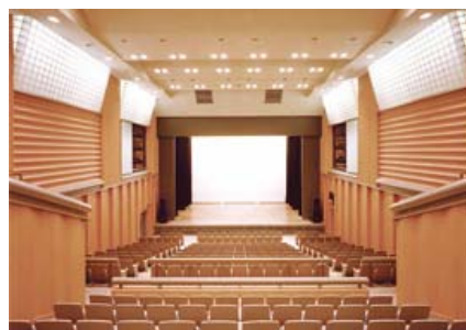
多目的ホール：区民文化センターで最も多いタイプ。可動式の音響反射板を用い音響効果を変化させることで様々なジャンルの公演に対応します。