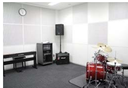
鶴見区「サルビアホール」練習室