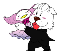
キャプテンわん (C)ゆず葉 (株)横浜体育協会