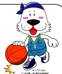
キャプテンわん (C)ゆず組 / (株)横浜市体育協会