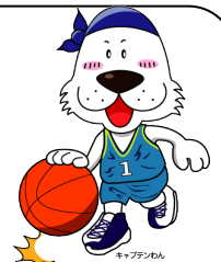
キャプテンわん (C)ゆず葉 (株)横浜体育協会