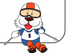
キャプテンわん (C)ゆず組 / (株)横浜市体育協会