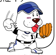
キャプテンわん