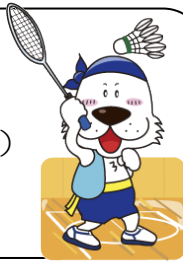
キャプテンわん (C)ゆず葉 (株)横浜体育協会