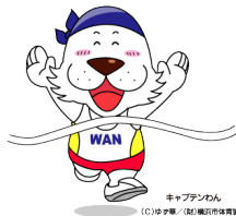
キャプテンわん