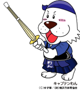
キャプテンわん (C)ゆず葉 (株)横浜体育協会