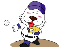
キャプテンわん (C)ゆず葉 (株)横浜体育協会