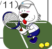
キャプテンわん (C)ゆず葉 (株)横浜体育協会