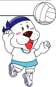
キャプテンわん