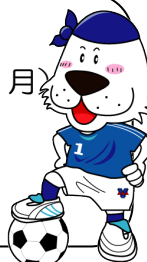
キャプテンわん (C)ゆず葉 (株)横浜体育協会