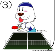
キャプテンわん