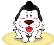
キャプテンわん (C)ゆず葉 (株)横浜体育協会