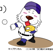
キャプテンわん (C)ゆず組 / (株)横浜市体育協会