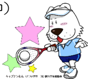
キャプテンわん (C)ゆず組 / (株)横浜市体育協会