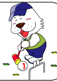
キャプテンわん (C)ゆず葉 (株)横浜体育協会