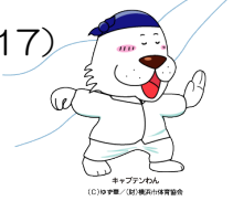
キャプテンわん (C)ゆず葉 (株)横浜体育協会