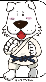
キャプテンわん (C)ゆず葉 (株)横浜体育協会