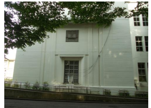
日吉台地下壕保存の会 http://hiyoshidai-chikagou.net/