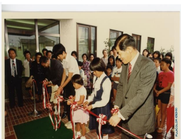
昭和55年8月27日開館記念式典テープカット