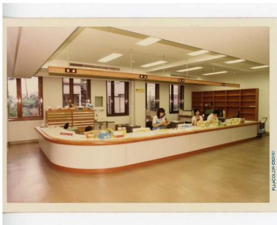
35年前開設当時の図書館受付カウンター

今から35年前の昭和55年(1980年)8月27日に、旧港北区役所から港北図書館と菊名地区センターが生まれました！開館当時の懐かしい写真などを展示します。