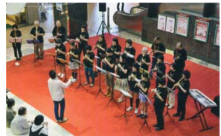
商店街でのコンサート (地域連携事業)

このような役割や事業を実施するためには、それに見合った運営体制を構築することが必要です。例えば、文化活動のコーディネーターや舞台技術者など文化芸術の専門人材の適切な配置や、利用者・来館者が使いやすい利用方法の設定などがこれにあたります。