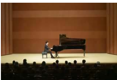
区民文化センター主催公演 (鑑賞型事業)

※区民文化センター主催の自主企画事業の例としては、公演などの鑑賞型事業、ワークショップなどの参加型事業、地域文化を支える人材を育てる人材育成事業、日頃芸術に触れることの少ない人向けに行われる普及事業、まちなかコンサートなどの地域連携事業などがあります。