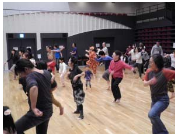
ダンスのワークショップ (参加型事業)