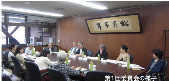
第1回委員会の様子

区民文化センターの整備にあたり、区民の皆さんにとって「身近な文化活動の拠点」となるよう、施設の基本的な方向性や、求められる機能、施設の管理運営や事業等について検討を行い、「基本構想（答申）」としてとりまとめるため、8月27日（木）に「第1回 横浜市港北区における区民文化センター基本構想検討委員会」を開催しました。