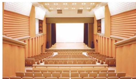
神奈川区民文化センター かなっくホール

地域に根差した個性ある文化の創造に寄与するために、横浜市区民文化センター条例に基づき設置される「 地域文化芸術活動の拠点 」です。標準的な機能としてはホール・音楽ルーム・練習室・ギャラリー・会議室・情報コーナーなどを有しています。横浜市内では現在10館の区民文化センター（旭・青葉・泉・港南・栄・神奈川・磯子・鶴見・戸塚・緑）があります。