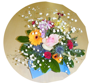
フラワーアレンジメント教室の作品 (オリーブの会)