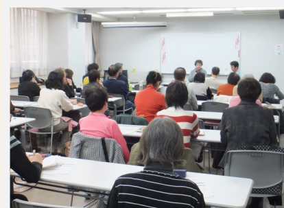
普及啓発活動の様子