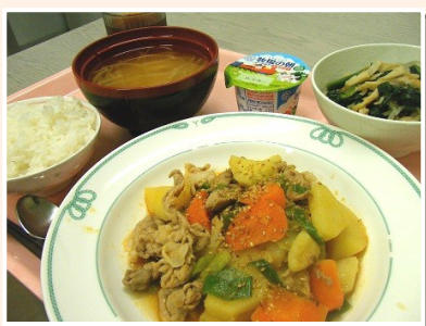
夕食サービスの様子

その他、入浴サービス（浴室の提供）ランドリーサービス（洗濯機・乾燥機の貸し出し）等を100円で行っています。