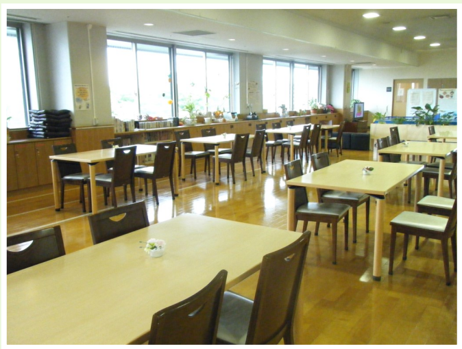
港北区生活支援センターのフリースペースの様子