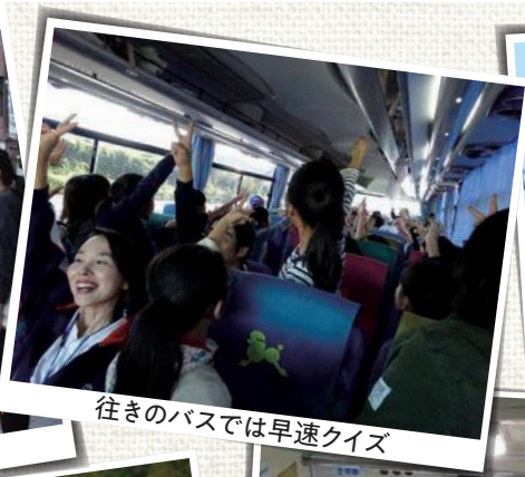
往きのバスでは早速クイズ