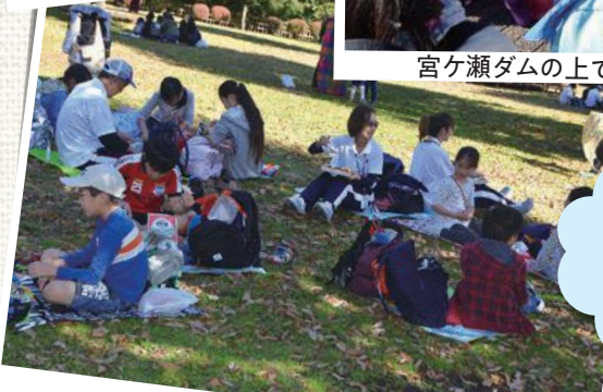
ふれあい広場で昼食