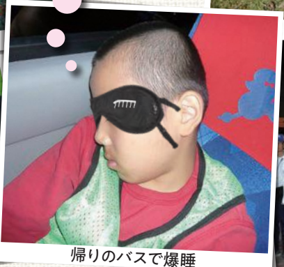
帰りのバスで爆睡