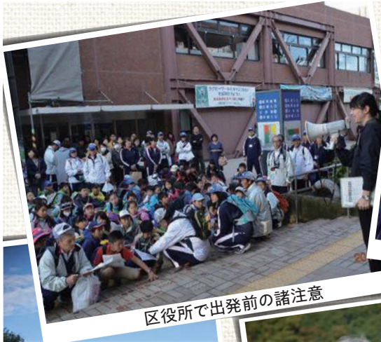
区役所で出発前の諸注意