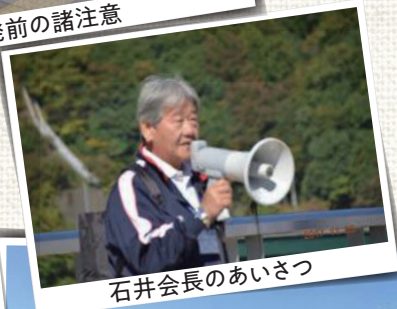
石井会長のあいさつ