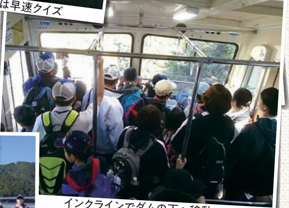
インクラインでダムの下へ移動