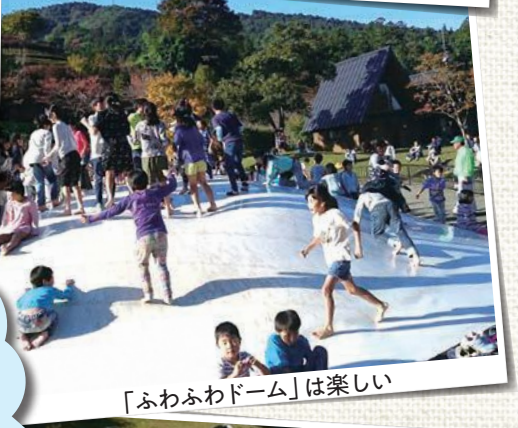
「ふわふわドーム」は楽しい