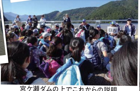
宮ヶ瀬ダムの上でこれからの説明