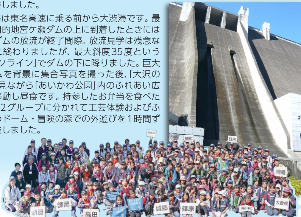
宮ヶ瀬ダムを背景に全員で記念写真