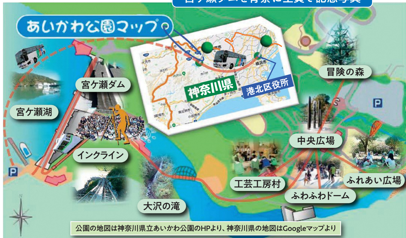
公園の地図は神奈川県立あいかわ公園のHPより、神奈川県の地図はGoogleマップより