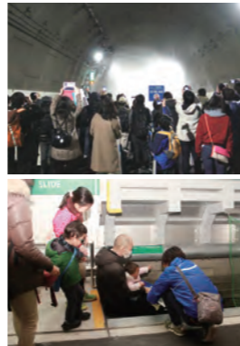
水噴霧デモンストレーション(写真上)と避難施設体験(写真下)

場所: 北八朔換気所付近 募集人数: 10,000人程度 申込方法: ホームページからのみとなります。ご了承ください。 https://www.shutoko.jp/ss/hokusei-sen/event/opening/walk.html