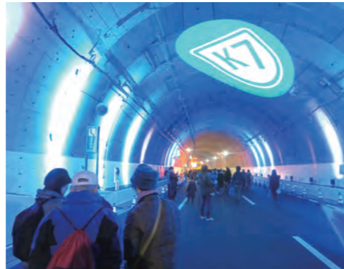
見て・歩いて・体験して!楽しい企画が盛りだくさん ※企画の内容は検討中です

K7横浜北西線の横浜青葉ジャンクション付近とトンネル内のコースを歩いて見学していただけます。トンネル内では、さまざまな展示やK7横浜北西線の防災設備の紹介など、楽しい企画が盛りだくさん!