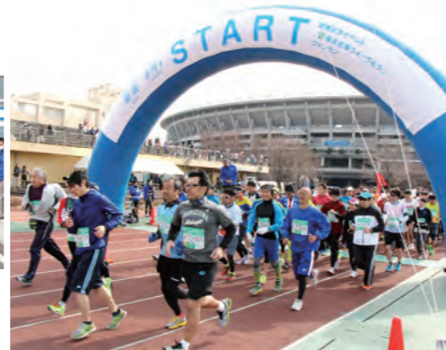
スタートは日産スタジアム

コース: 開通前のK7横浜北西線を含む約16km 定員: 2,000人程度 ※応募者多数の場合、抽選となります。 申込方法: ホームページからのみとなります。ご了承ください。 https://www.shutoko.jp/ss/hokusei-sen/event/opening/funrun.html