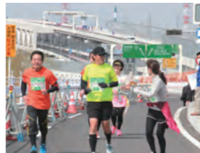
横浜北西線の全区間を走り抜けます

日産スタジアムをスタートしてK7横浜北西線の横浜青葉ジャンクションへ。そこから横浜北西トンネルを通過して横浜港北ジャンクションまで走っていただきます。コースの全長は約16km。マラソンファンは集まれ!