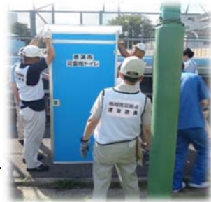
災害用 仮設トイレ▶