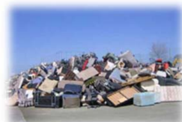
▲ 仮置場（仙台市の例）

解体業者等が仮置場に搬入します。仮置場は、必要面積を算定したうえで、他の利用目的での土地利用も考慮して設置します。