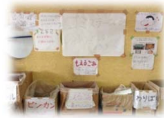
▲ 熊本地震での避難所のごみ分別の様子

平時のごみ排出ルール（分別区分）のとおり、普段のごみ集積場所や地域防災拠点ごとに定められたごみ集積場所へ排出していただきます。