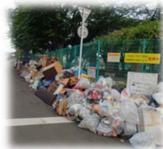
▲ 区別して排出することの必要性

片付けごみの排出場所について、普段のごみ集積場所は使わず、近隣の空き地や通行の妨げにならない場所へ排出していただきます。