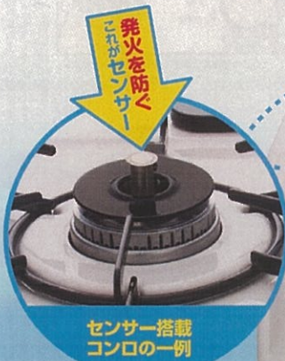
センサー搭載 コンロの一例