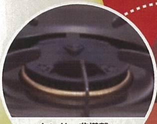
センサー非搭載 コンロの一例