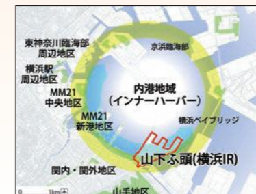
「美しい港の景観形成構想」 「横浜市都心臨海部再生マスタープラン」より作成