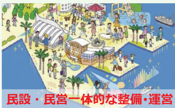
民設・民営一体的な整備・運営